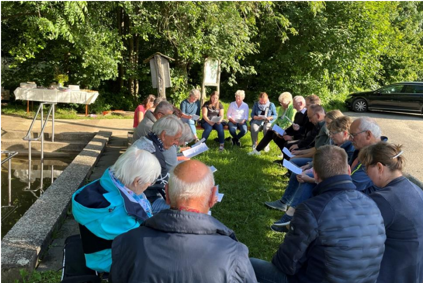
Spirituell auftanken – „Bibel und Brotzeit“ an der Steinernen Rinne in Rohrbach