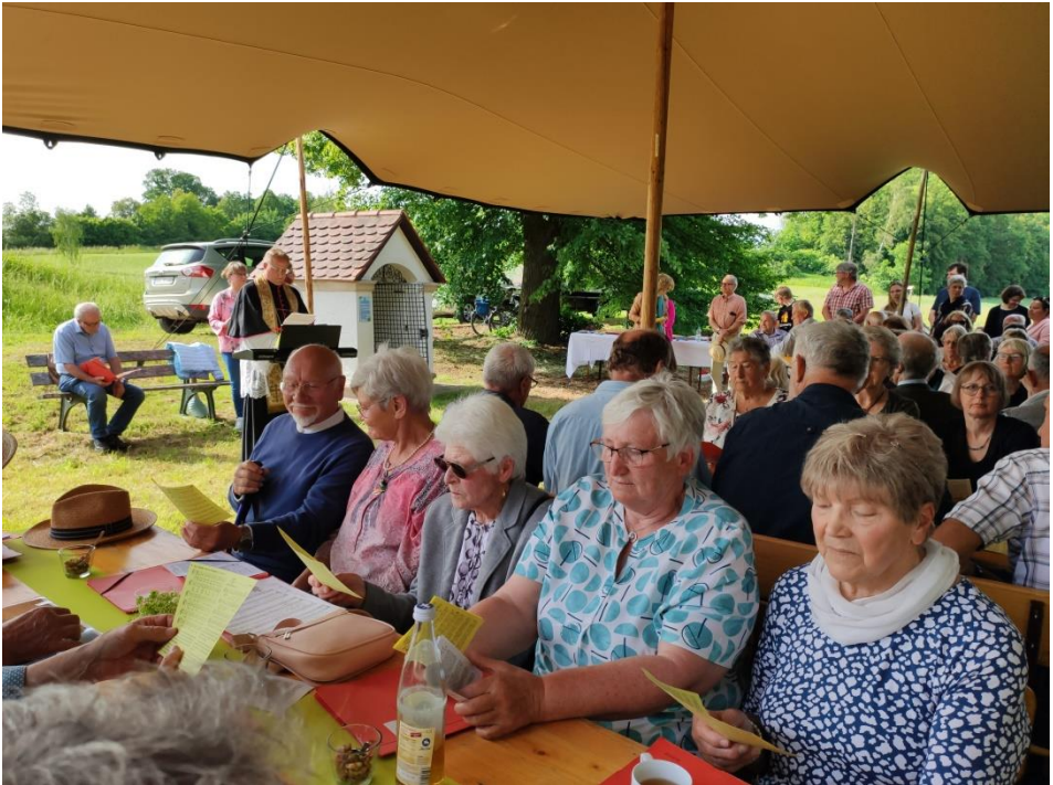
Rege Teilnahme an der Einweihungsandacht der neu renovierten Marienkapelle – mitgestaltet von Kirchenchor St. Georg.