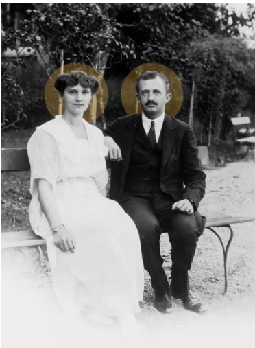
Kaiserin Zita und ihr Mann Kaiser Karl I.