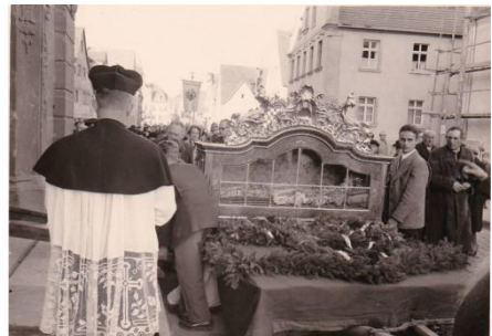
Bilder von der festlichen Prozession durch Ellingen zur Stadtpfarrkirche 1955