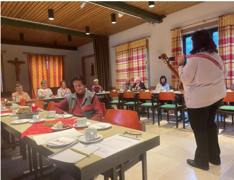
Stimmungsvoller Advent im Ellinger Frauenkreis – offen für ALLE, 2023