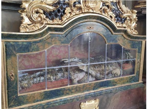
Aktuelles Bild vom Reliquien-Schrein

Es ist wie so oft schwer, Legenden und Wirklichkeit auseinander zu halten. Die kath. Kirche kennt offiziell fünf Hl. Severine, deren letzte Ruhestätten bekannt sind. Unser Severin