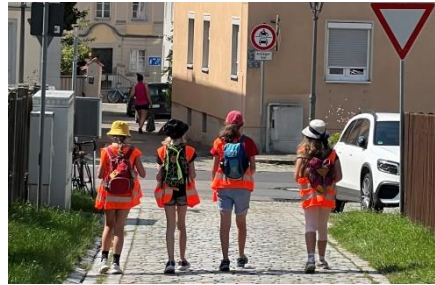
Unterwegs bei der Schnitzeljagd

Anfang Oktober fand die Altkleidersammlung statt. Vielen Dank an alle, die für uns saubere Altkleider bereitstellen, damit wir durch den Erlös die Vereinsarbeit und Projekte der Entwicklungshilfe unterstützen können.