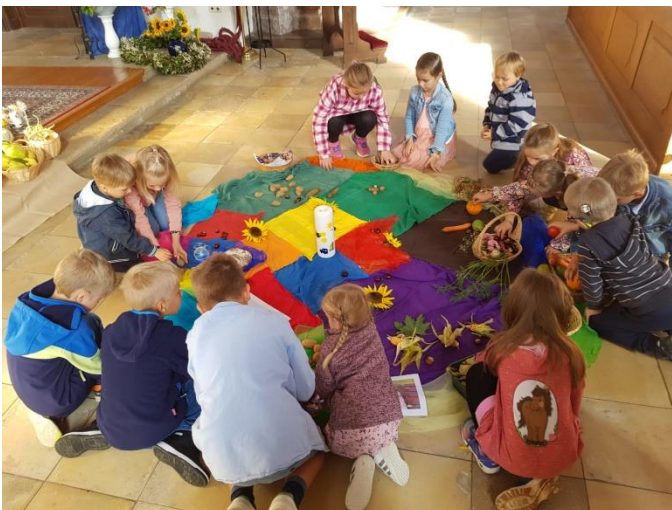
Mit Freude und Eifer dabei - gemeinsam entstand ein bunter Erntedank-Teppich vor dem Altar